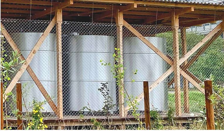
10 MWh Speicheranlage am ETH-Campus Hönggerberg

Der Bund weist im Monitoring zur Energiestrategie 2050 einige Erfolge aus; so sinkt der Energieverbrauch pro Person und Jahr und die Energie aus Erneuerbaren nimmt zu.